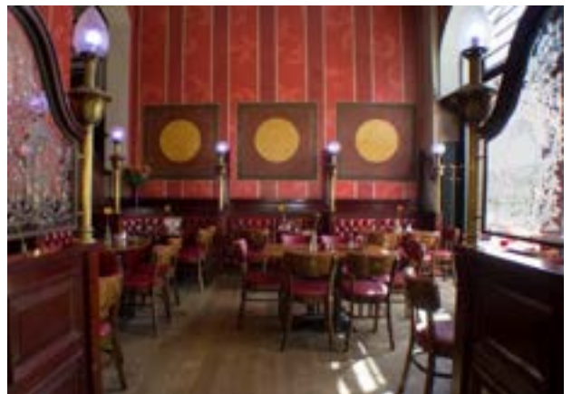
Die gemütliche Räumlichkeit im englischen Styl