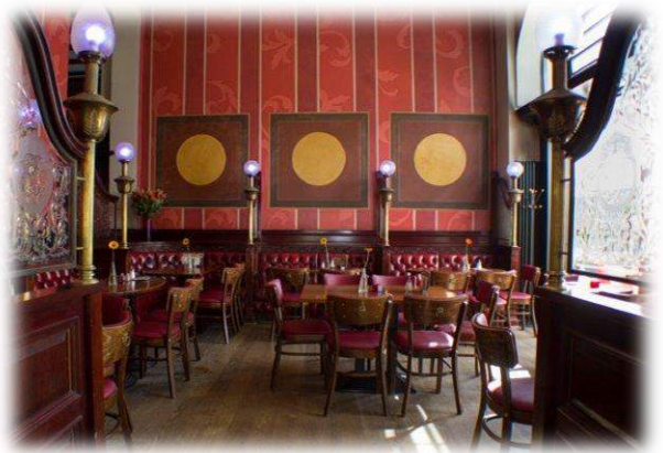
Die gemütliche Räumlichkeit im englischen Styl