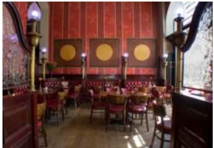
Die gemütliche Räumlichkeit im englischen Styl